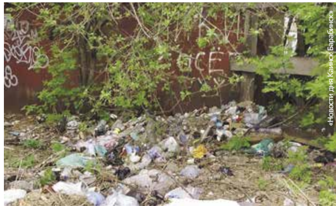
НА ФОТО: МУСОР У ДЕТСКОГО САДА «ЗВЕЗДОЧКА»

С оциальные сети пестрят неприглядными кадрами несанкционированных свалок возле детских садов: пластиковые бутылки, пакеты, отходы — «прекрасный» фон для формирования первых впечатлений о родном городе у юных куйбышевцев. Тем более, что раньше такого не было: пищевые отходы шли на корм скоту, макулатура, металлолом, стекло — все сдавалось в пункты приема.